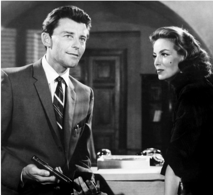
1959 LA FIÈVRE MONTE À EL PAO (Los Ambiciosos) de Luis Buñuel avec Gérard Philipe