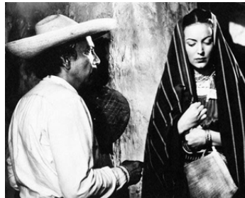
1948 MACLOVIA (Maclovía) d'Emilio Fernandez avec Miguel Inclán