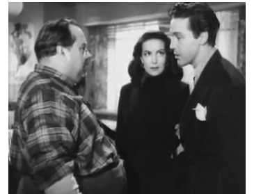
1949 UNE FEMME COMME TANT D'AUTRES (Una mujer cualquiera) de Rafael Gil avec José Nieto