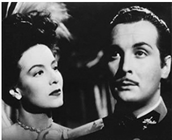
1945 LA FEMME DE TOUT LE MONDE (La Mujer de todos) de Julio Bracho avec Armando Calvo