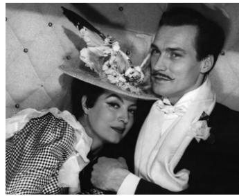
1954 LA BELLE OTERO (La bella Otero) de Richard Pottier avec Jacques Berthier