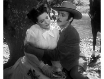
1945 AMOUR DÉFENDU (Vertigo) d'Antonio Momplet avec Emilio Tuero