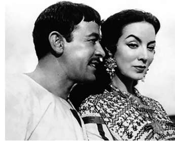
1956 QUAND GRONDE LA COLÈRE (Tizoc, amor indio) d'Ismael Rodriguez avec Pedro Infante