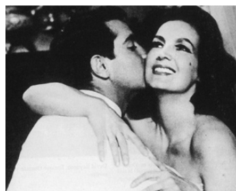
1963 AMOUR ET SEXE (Amor y sexo) de Luis Alcoriza avec Julio Aleman