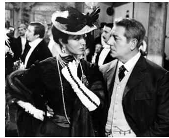
1954 FRENCH CANCAN de Jean Renoir avec Jean Gabin