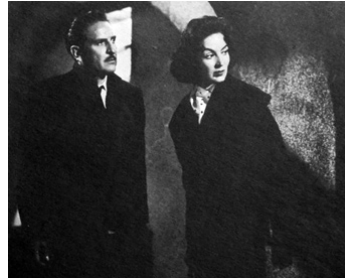
1957 MERCREDI DE CENDRES (Miercoles de ceniza) de R. Gavaldon avec Arturo de Cordova