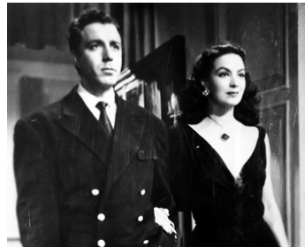
1948 DU SANG À L'AUBE (Mare nostrum) de Rafael Gil avec Fernando Rey