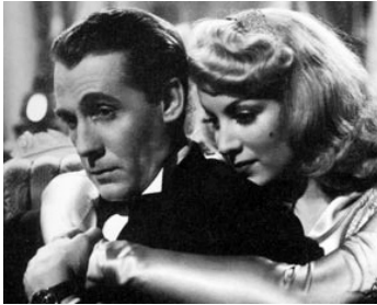
1944 AMOK (Amok) d'Antonio Momplet avec Julian Soler