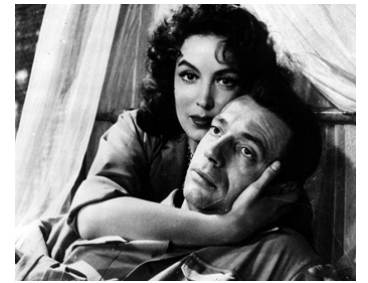
1955 LES HÉROS SONT FATIGUÉS d'Yves Ciampi avec Yves Montand