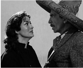
1955 CELLE QUE L'ON CACHE (La Escondida) de Roberto Gavaldon avec Andrés Soler