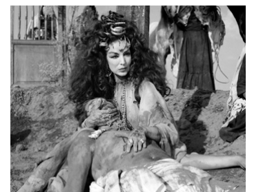
1969 LA GÉNÉRALE (La Generala) de Juan Ibañez avec Carlos Bracho