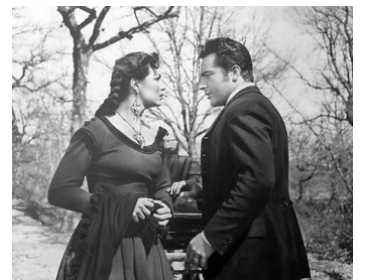
1950 TRÉSOR MAUDIT (Incantesimo tragico) de Mario Sequi avec Rossano Brazzi