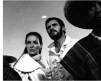
1959 SONATAS (Las aventuras del marqués de Bradomin) de J-A. Bardem avec Francisco Rabal