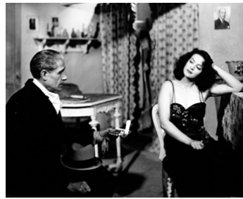
1943 LA FEMME SANS CŒUR (La Mujer sin alma) de Fernando de Fuentes avec Fernando Soler