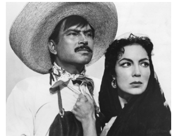
1947 RIO ESCONDIDO (Rio Escondido) d'Emilio Fernandez avec Pedro Armendariz