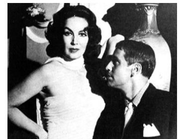
1961 SI YO FUERA MILLONARIO de Julian Soler avec Enrique Rambal