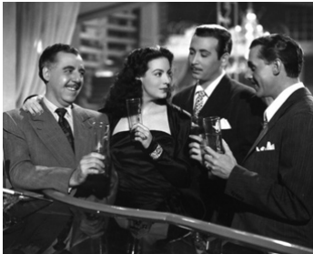
1947 PARDONNEZ-MOI (Que Dios me perdone) de Tito Davison avec F. Soler, A. Calvo, J. Soler