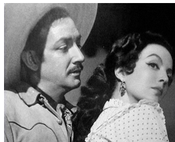
1950 L'ENLÈVEMENT (El Rapto) d'Emilio Fernandez avec Jorge Negrete