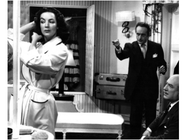
1956 FAUSTINA (Faustina) de J-L Saenz de Heredia avec F. Fernan Gomez, Conrado San Martin