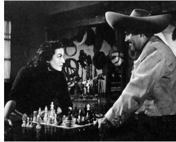
1956 CANASTA (Canasta de cuentos mexicanos) de Julio Bracho avec Pedro Armendariz