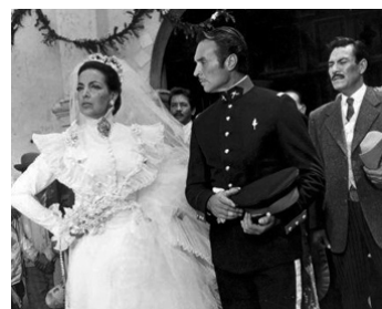
1964 LA VALENTINA de Rogelio A. Gonzalez avec Eulalio Gonzalez, Pedro Armendariz