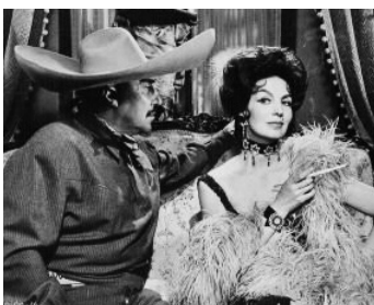
1962 LA BANDIDA (La Bandida) de Roberto Rodriguez avec Pedro Armendariz