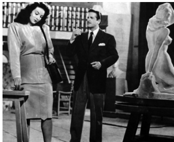
1946 LA DÉESSE ARRODILLÉE (La Diosa arrodillada) de R. Gavaldon avec A. De Cordova