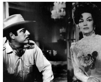
1960 LA GRANDE RÉVOLTE (Juana Gallo) de Miguel Zacarias avec Luis Aguilar