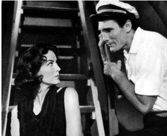
1957 LE TUMULTE DES SENTIMENTS (Flor de Mayo) de Roberto Gavaldon avec Jack Palance