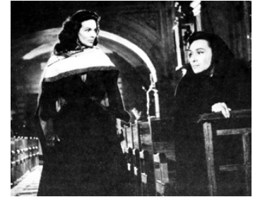
1959 LA CUCARACHA (La Cucaracha) d'Ismael Rodriguez avec Dolores Del Rio