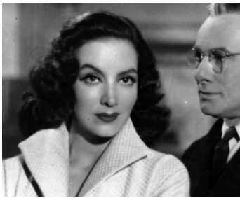
1953 LE CALVAIRE D'UNE COURTISANE (La Pasion desnuda) de L-C. Amadori avec Eduardo Cuitiño