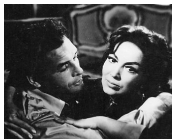
1952 PASSION SAUVAGE (Camelia) de Roberto Gavaldon avec Jorge Mistral