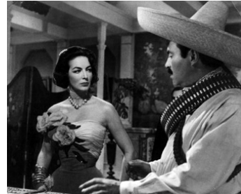
1958 FANTAISIE MEXICAINE (Café Colon) de Benito Alazraki avec Pedro Armendariz