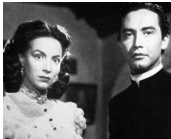
1946 ENAMORADA (Enamorada) d'Emilio Fernandez avec Fernando Fernandez