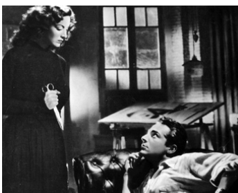
1951 LA COURONNE NOIRE (La Corona nera) de Luis Saslavsky avec Rossano Brazzi