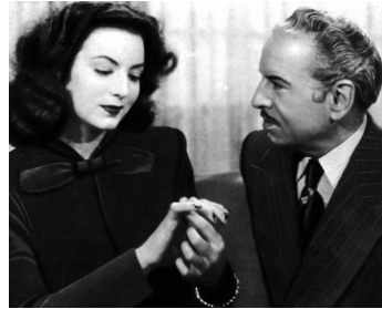
1945 LA DEVORADORA de Fernando de Fuentes avec Julio Villareal