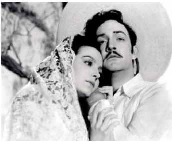
1942 LE ROCHER DES ÂMES (El Peñon de las almas) de Miguel Zacarias avec Jorge Negrete