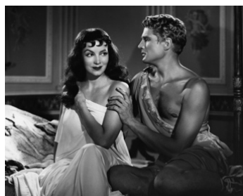
1951 MESSALINE (Messalina) de Carmine Gallone avec Georges Marchal