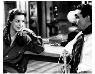
1943 DOÑA BARBARA de Fernando de Fuentes et Miguel M. Delgado avec Julian Soler